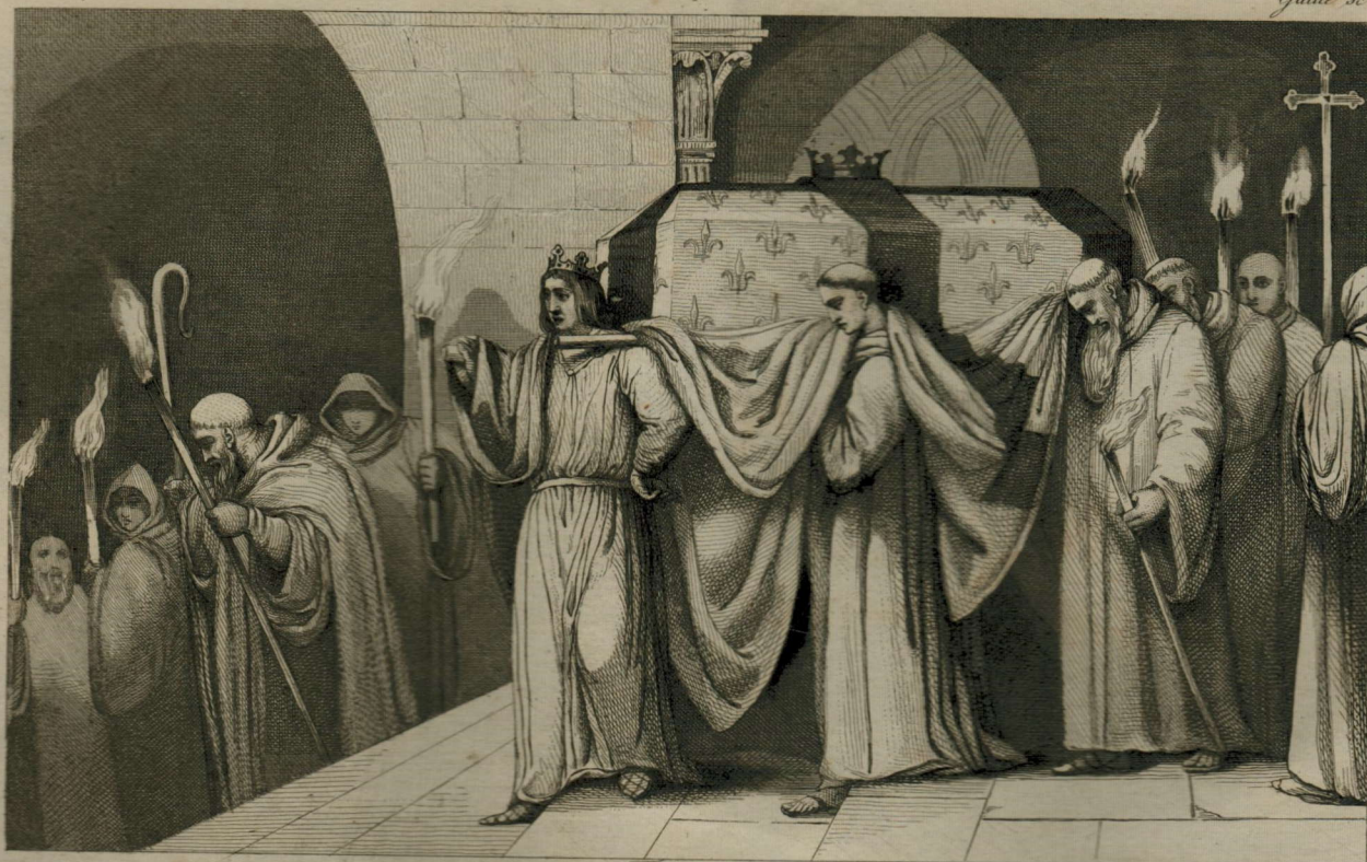
1272 Galles 1273 Autriche 1282 Aragon 1285 3 morts